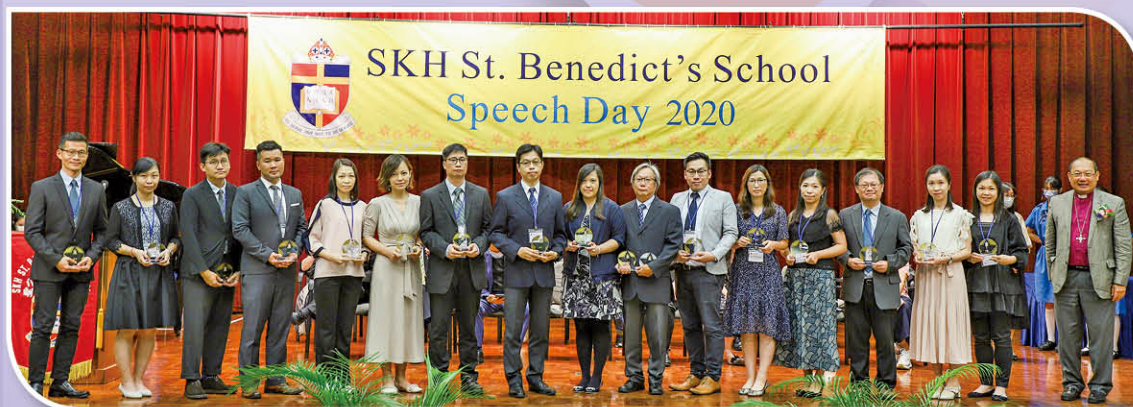
優秀教學表現 金獎任教老師

校 方每年都會嘉許任教中學文憑考試中成績優異或增值突出學科的老師，以表揚他們的付出與貢獻。於 2019 年中學文憑考試獲得優秀教學表現金獎的有任教中國語文、數學、企業會計與財務概論、物理、中國歷史及旅遊與款待等 6 科共 17 位老師，而獲得銀獎的有任教英文、通識教育、經濟、生物、地理及數學科 ( 延伸部份單元 ) 等 6 科共 16 位老師。