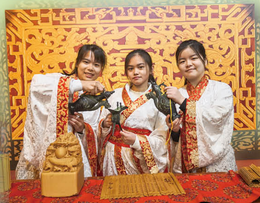
聖公會聖本德中學 西安歷史文化探索之旅