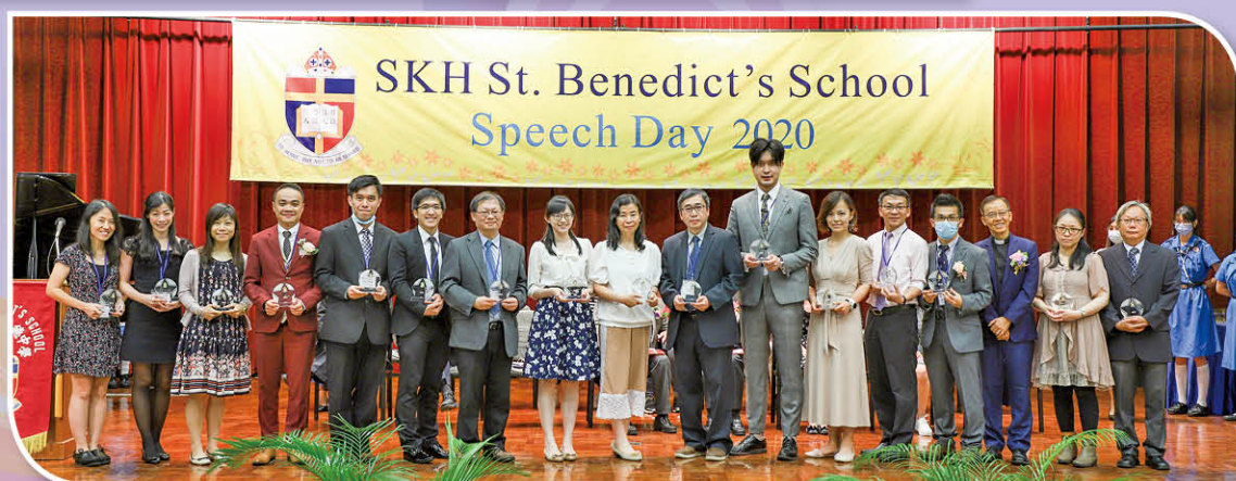
優秀教學表現 銀獎任教老師