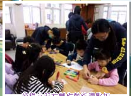
教導小朋友製作熱縮膠匙扣