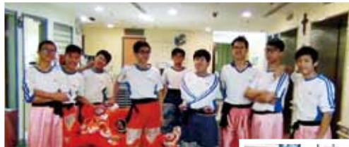
東華三院黃大仙醫院「金雞鳴春迎新歲」