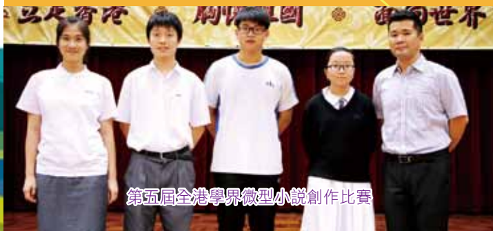
第五屆全港學界微型小說創作比賽