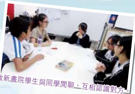
啟新書院學生與同學閒聊，互相認識對方。