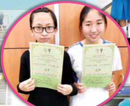
聖十架堂(棋藝康體日)層層疊及擲飛鏢冠軍