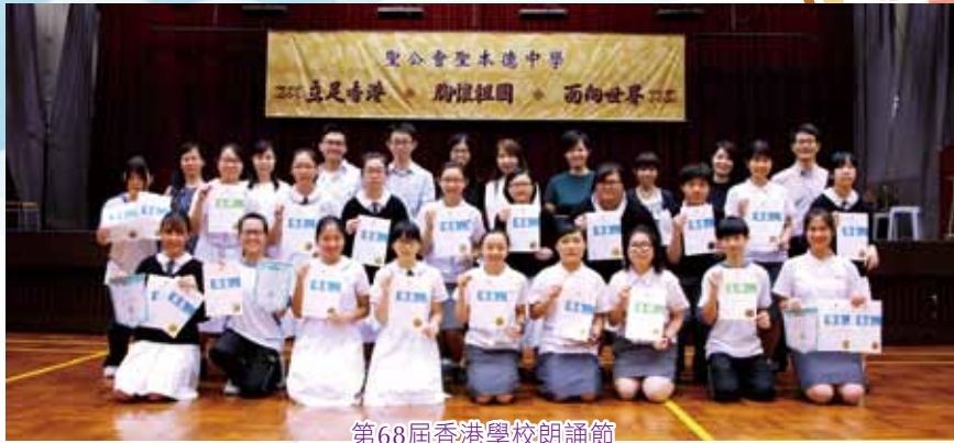
第68屆香港學校朗誦節