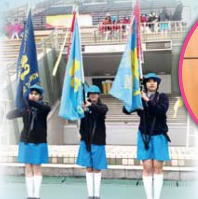
連續七屆獲獎金色彩帶