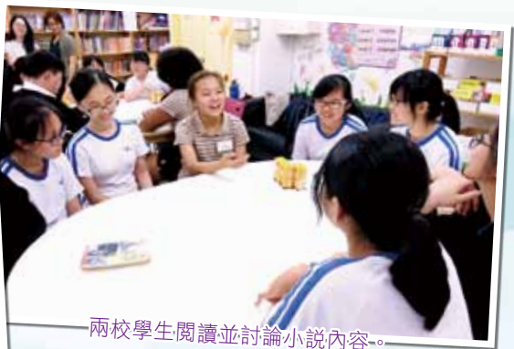
兩校學生閱讀並討論小說內容。