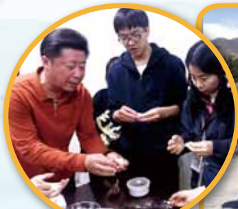
探訪當時居民及學習包餃子