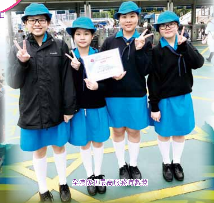
全港隊伍最高服務時數獎