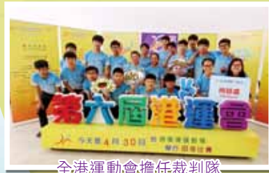
全港運動會擔任裁判隊