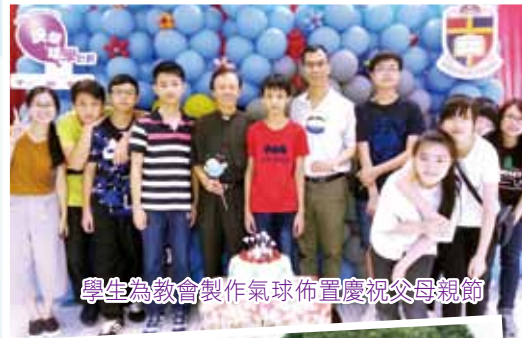
學生為教會製作氣球佈置慶祝父母親節