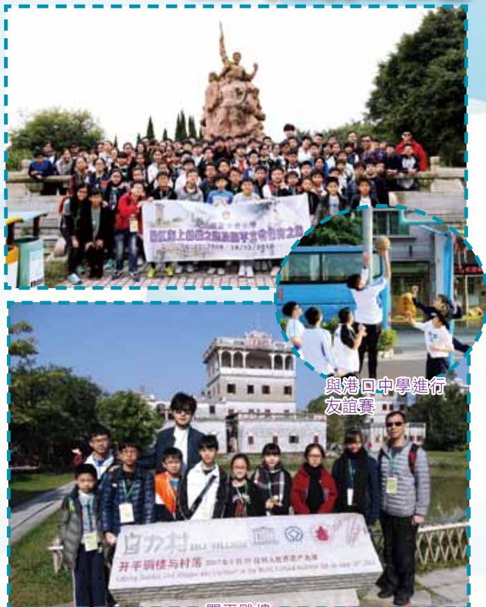
與港口中學進行友誼賽