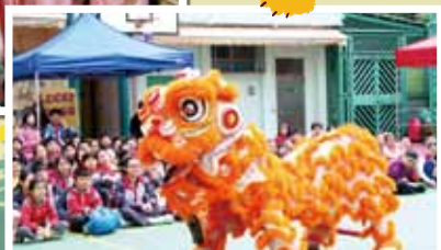
為聖文德小學及黃大仙官立小學迎新春活動助慶。