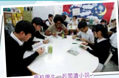
兩校學生一起閱讀小說。