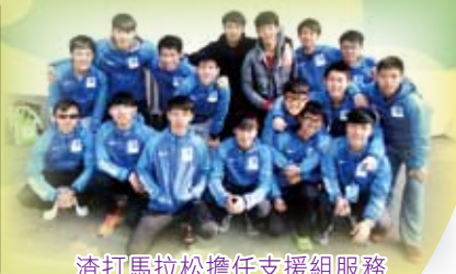
渣打馬拉松擔任支援組服務