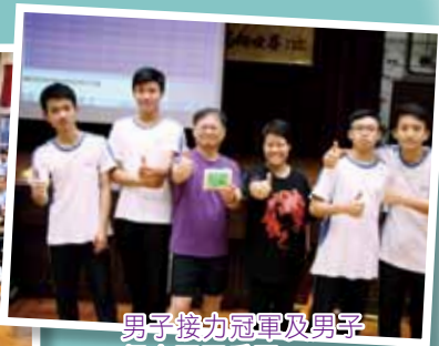
男子接力冠軍及男子個人冠亞季軍