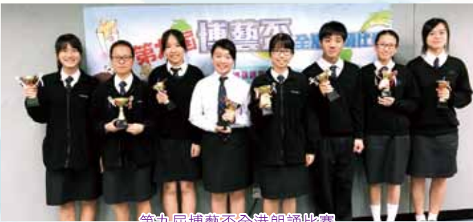
第九屆博藝盃全港朗誦比賽