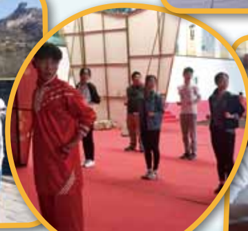
探訪武術學校及學習拳術