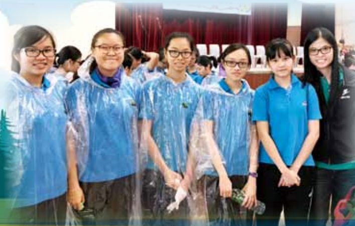
女童軍銀盾比賽總成績全港第五名