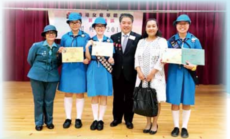
黃大仙區優秀女童軍

我很高興能當選成為「黃大仙區優秀女童軍」。我要感謝女童軍領袖老師六年來的悉心栽培，領袖老師的言教和身教，讓我領悟認真做事的重要，是我的學習榜樣。希望我校的女童軍繼續挑戰自我、熱心助人，成為更好、更優秀的女童軍。