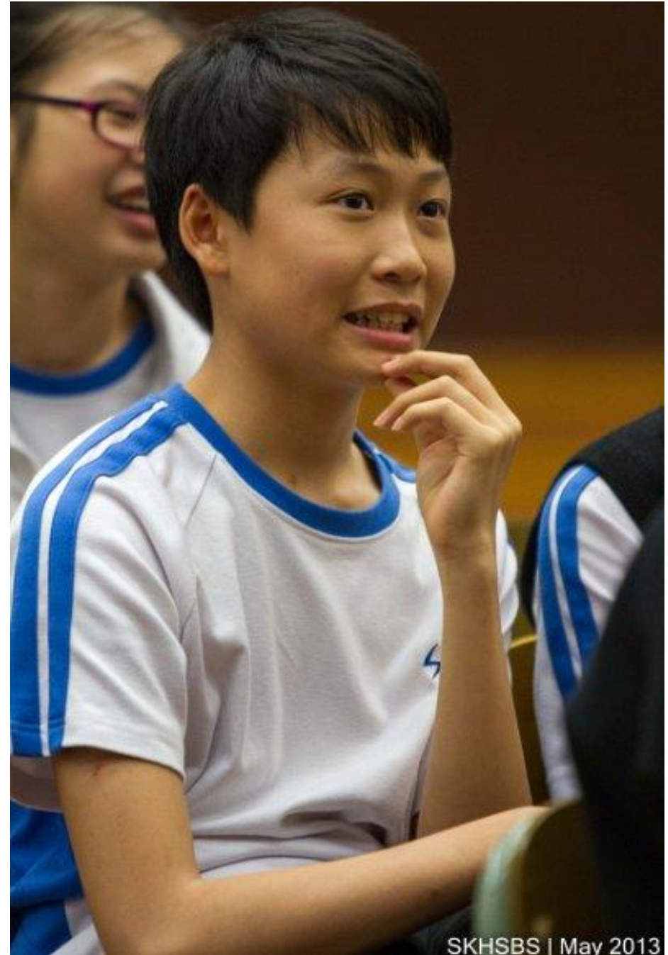
SKHSBS | May 2013