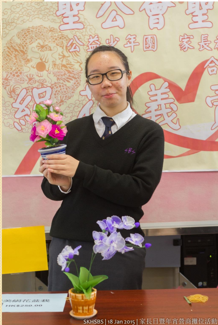
SKHSBS | 18 Jan 2015 | 家長日暨年宵營商攤位活動