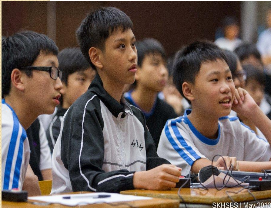
SKHSBS | May 2013