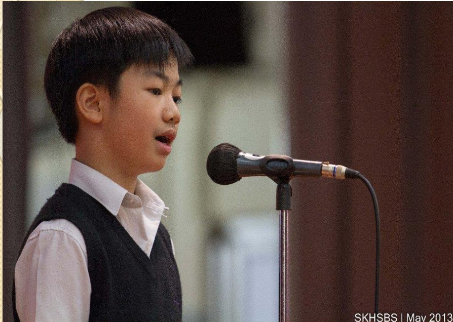
SKHSBS | May 2013