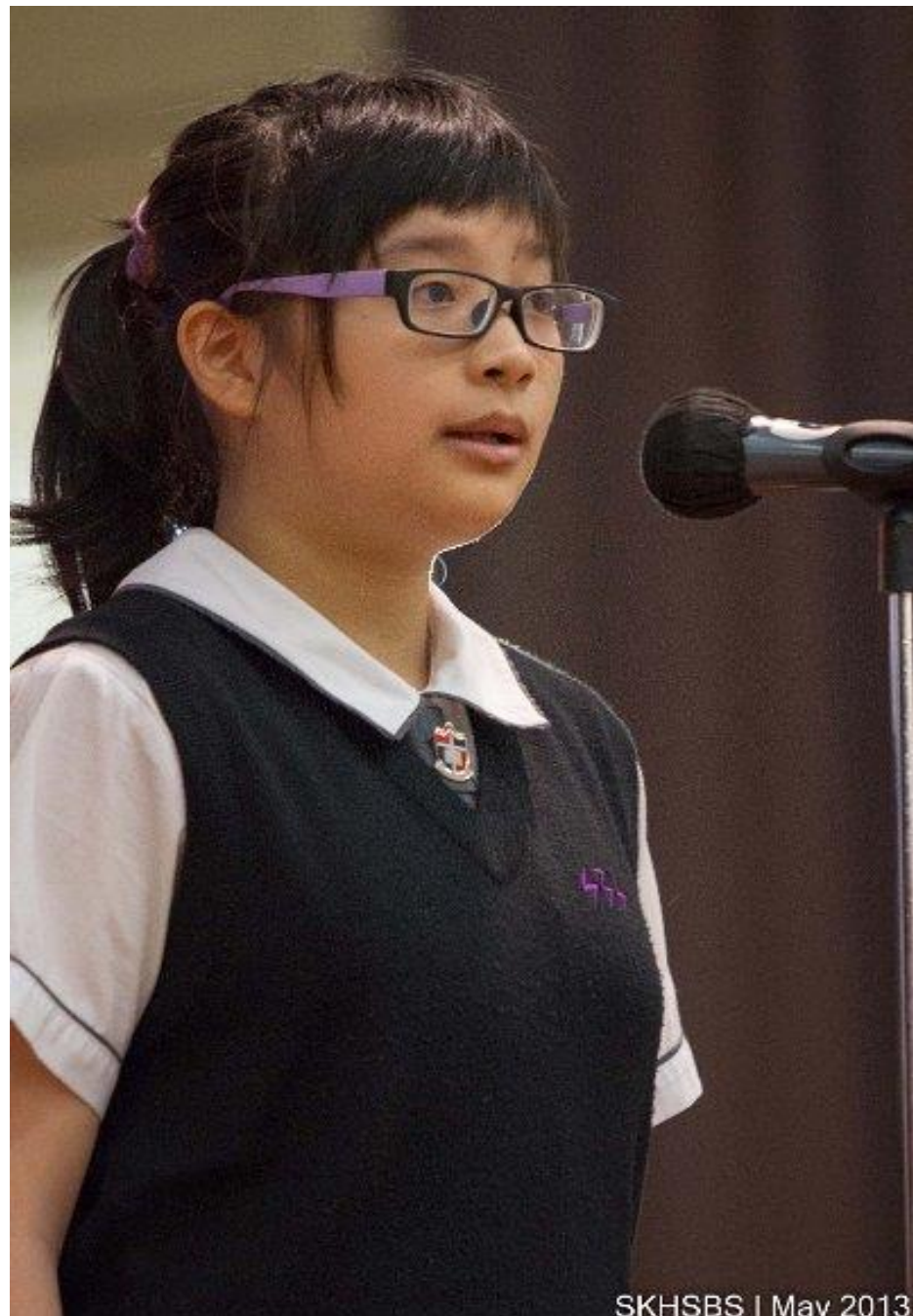
SKHSBS | May 2013